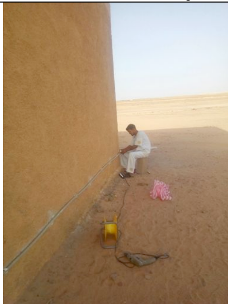
Scuola Veterinaria - idraulico