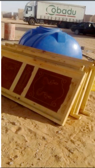
Dettagli 5 edifici del Ministero de Desarrollo