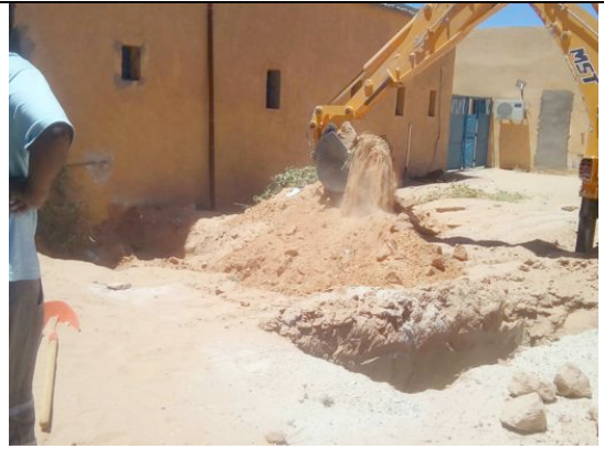
Scuola Veterinaria Fosse biologiche