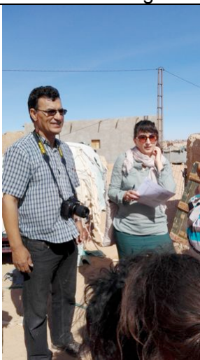
Visita alle beneficiarie dell'attività di semina di Moringa (Auserd – Tichla)