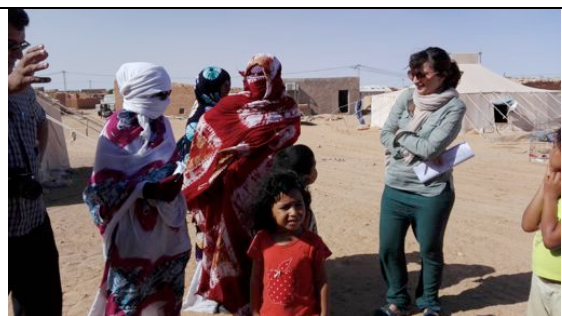
Visita alle beneficiarie dell'attività di semina di Moringa (Auserd – Tichla)