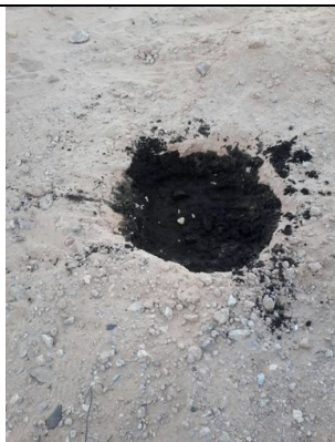
Preparazione terreno con torba per la semina

Ogni visita è stata occasione per rispondere ai dubbi delle famiglie, per correggere gli errori d'irrigazione e per rinforzare il messaggio legato al potenziale nutrizionale delle foglie. Intanto stiamo preparando nel Centro Experimental de Formacion Agricola un vivaio. Gli alberi che vi cresceranno saranno trapiantati presso le famiglie beneficiarie a fine settembre per sostituire quelli eventualmente danneggiati da difetti d'irrigazione nel periodo estivo.