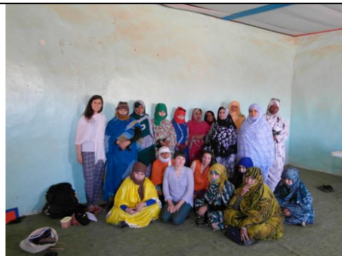
Riunione con alcune donne beneficiarie dell'attività di rafforzamento di attività generatrici di reddito