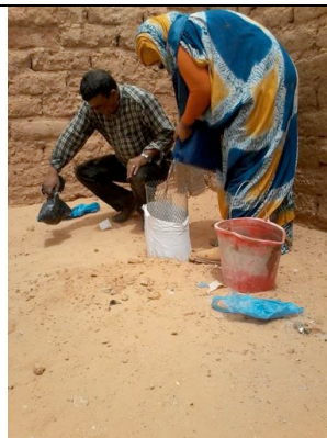
Installazione dei protettori metallici e del sistema di irrigazione