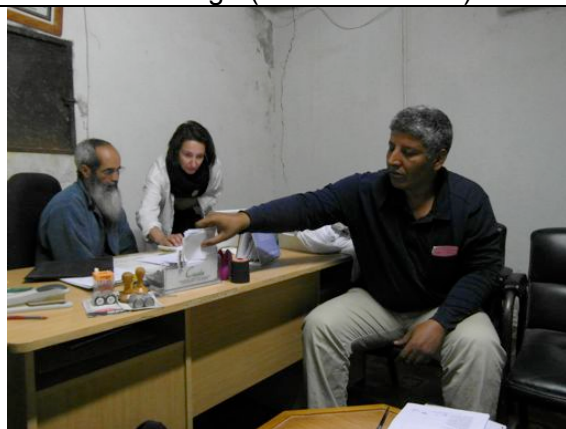
Riunione con il Direttore e con il veterinario incaricato dell'allevamento di ovaiole