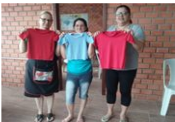
Alunas mostrando as peças produzidas no curso de costura.

No curso de costura as participantes aprenderam a manusear as máquinas retas e overlocke, além de conhecimentos básicos de costura, os quais resultaram na confecção das primeiras peças por elas produzidas.