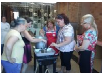
Aprendendo a trabalhar com os corantes naturais.

O curso de tingimento , por sua vez, possibilitou o aprendizado de técnicas naturais de coloração de tecidos, utilizando cascas de cebola, folhas de repolho, chás, entre outros.